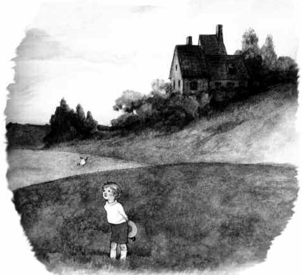
Immagine tratta da Rataplan , Giunti-Nardini Editore.